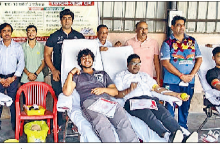
सोनीपत। शिविर में रक्तदाताओं का हौसला बढ़ाते हुए।