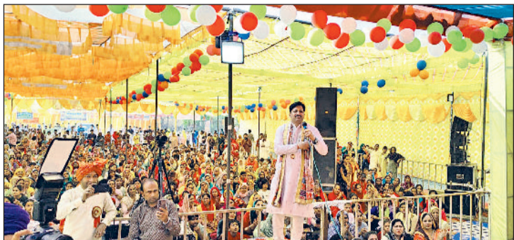
खरखोदा। कार्यक्रम में भजन सुनाते गायक।

श्रद्धालुओं के जयकारों से पूरा वातावरण भक्तिमय