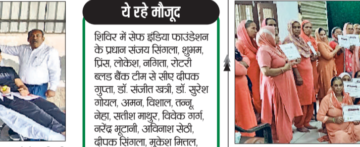
सोनीपत। डब्ल्यूसीडीपीओ निर्मल आंगनवाड़ी कार्यकर्ताओं को प्रशस्ति पत्र देते हुए।