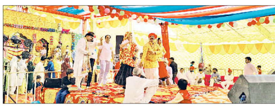
खरखोदा। भजनों पर नृत्य करते कलाकार।