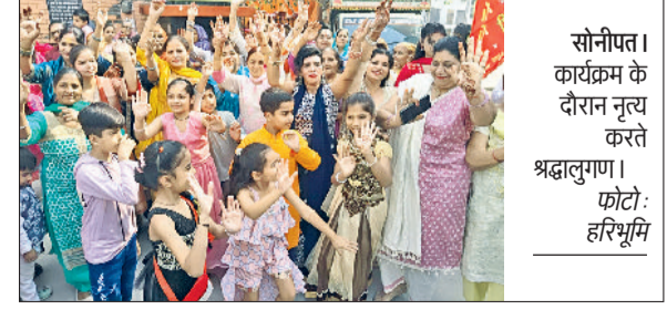
सोनीपत। कार्यक्रम के दौरान नृत्य करते श्रद्धालुगण।