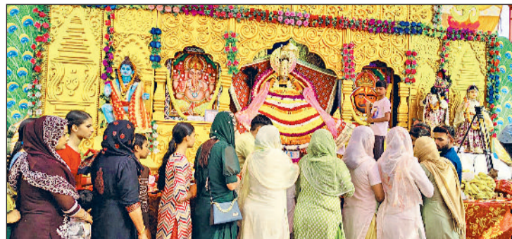
खरखोदा। श्री श्याम बाबा के समक्ष मत्था टेकते हुए महिलाएं।