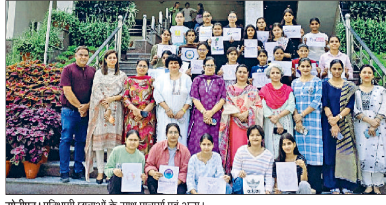
सोनीपत। प्रतिभागी छात्राओं के साथ प्रचारार्थ एवं अन्य।

जीवीएम गर्ल्स कॉलेज के जैव प्रौद्योगिकी विभाग द्वारा संस्थान नवाचार परिषद और बौद्धिक संपदा अधिकार सेल के सहयोग से 'स्केच टू सिंबल' लोगो डिजाइन प्रतियोगिता का सफल आयोजन किया गया। इस प्रतियोगिता का उद्देश्य विद्यार्थियों में सृजनात्मकता, मौलिकता और नवाचार की सोच को प्रोत्साहित करना तथा आधुनिक विज्ञान एवं उद्यमिता में पहचान निर्माण और बौद्धिक संपदा के महत्व को रेखांकित करना था। कार्यक्रम में