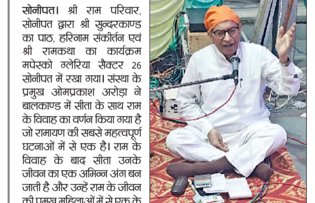
सोनीपत। कार्यक्रम के दौरान सुंदरकांड का पाठ करते हुए।