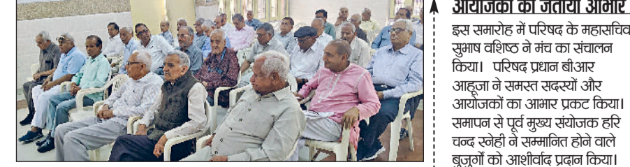
सोनीपत। कार्यक्रम के दौरान शामिल परिषद के पदाधिकारी एवं सदस्यगण।